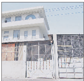
औद्योगिक क्षेत्र में चल रही फैक्ट्रियों के बाहर नहीं लगा कोई सूचालत्मक बोर्ड।

औद्योगिक क्षेत्र में अनेक निर्धारित मानकों का उल्लंघन होना विभिन्न सरकारी विभागों की कार्यप्रणाली पर सवालिया निशान लगा रहा है। हरियाणा शहरी विकास प्राधिकरण द्वारा विकसित इलाके में फैक्ट्रियों के निर्माण को लेकर नियम था कि भूखंड पर अधिकतम 65 फीसदी हिस्से पर ही निर्माण हो