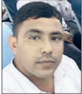
केवल चार दिन पहले हुए थे रिटायर