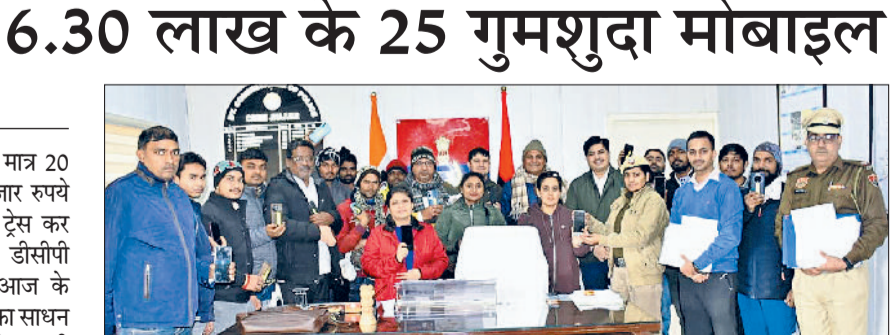
झंझर। गुम हुए मोबाइल मिलने पर पुलिस टीम के साथ खुशी जताते लोग।

भी समय रहते रोक लग सकी। उन्होंने आमजन से अपील करते हुए कहा कि मोबाइल गुम होने की स्थिति में तुरंत सीईआईआर पोर्टल पर शिकायत दर्ज कराएं ताकि मोबाइल को ब्लॉक कर जल्द से जल्द ट्रेस किया जा सके। उन्होंने बताया कि