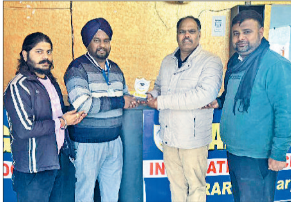
झज्जर। आयोजकों को स्मृति चिह्न भेंट करते हुए संस्था सदस्य।