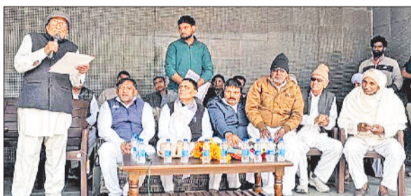
बहादुरगढ़। विधायक के समक्ष मांग रखते ग्रामीण।