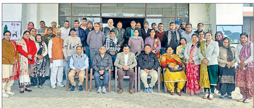
झज्जर। प्रशिक्षण के शुभारंभ पर प्रशिक्षणार्थी शिक्षकों के साथ उपस्थित जिला शिक्षा अधिकारी।