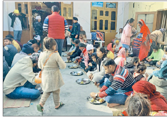
झज्जर। गुरुद्वारा साहिब भाई झंडा सिंह में लंगर छकते हुए श्रद्धालु।