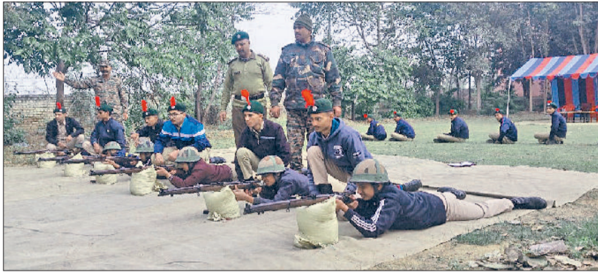
झज्जर। फायरिंग रेंज पर अभ्यास करते हुए एनसीसी कैडेट्स।