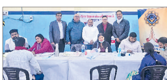
बहादुरगढ़। कैप में कर्मचारियों की सेहत जांचते स्वास्थ्यकर्मी।